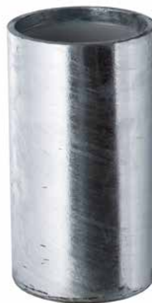
Modelo de la imagen: 8000089 Las medidas se indican en la página 2